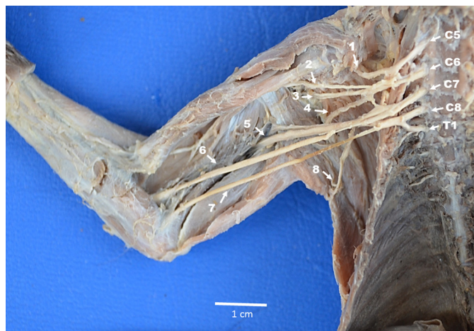
Fig.2. Vista ventral do plexo braquial do sagui-de-tufos-brancos ( Callithrix jacchus ). Nervo supraescapular (1), nervo musculocutâneo (2), nervo axilar (3), nervo subescapular (4), nervo radial (5), nervo mediano (6), nervos ulnar (7), nervo toracodorsal (8). Nervo cervical 5 (C5), nervo cervical 6 (C6), nervo cervical 7 (C7), nervo cervical 8 (C8), nervo torácico 1 (T1).