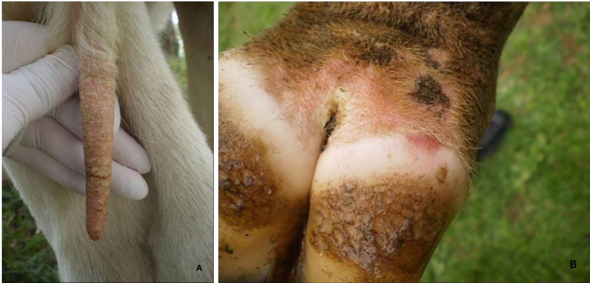
Fig.2. (A) Alopecia da extremidade da cauda do Bovino 3 submetido a intoxicação experimental por inflorescências de Sporobolus indicus infectadas por Bipolaris sp. Fissuras e crostas na extremidade distal. (B) Hiperemia na coroa do casco.

Em bovinos a hipertermia, taquicardia, taquipneia, hiperemia da coroa do casco e perda de pêlos da extremidade da cauda, causadas pela ingestão de sementes de S. indicus contaminadas por B. australis deve ser diferenciado de outras enfermidades. Dentre estas, podem ser citadas a intoxicação por C. purpurea (Belser-Ehrlich et al. 2013), cujos sinais clínicos e lesões são semelhantes; Neotyphodium coenophialum , um fungo endofítico que infecta festuca ( Festuca arundinacea ) onde causa hipertermia, baixo desenvolvimento, diminuição da produção de leite e do desempenho reprodutivo (Bhusari et al. 2007). Deve-se diferenciar também da intoxicação pelo cogumelo Ramaria flavo-brunnescens que pode causar entre outros sinais o desprendimento dos pêlos da extremidade da cauda, salivação, lesões necróticas da coroa do casco e perda de peso (Barros et al. 2006).